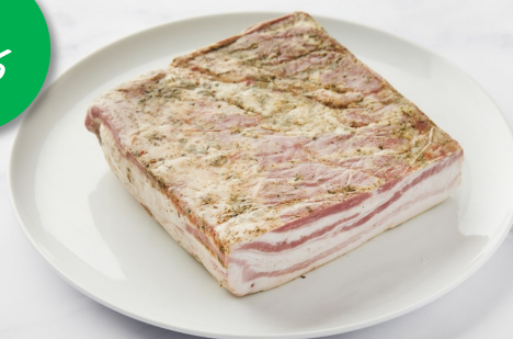
Iberisch Traag gegaard buikspek