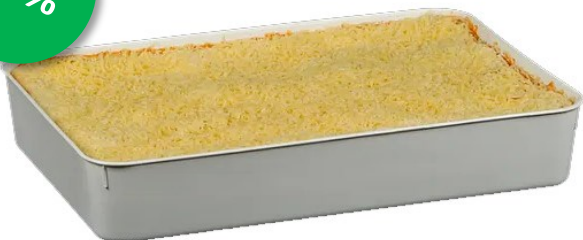
Lasagne Cru's 5kg