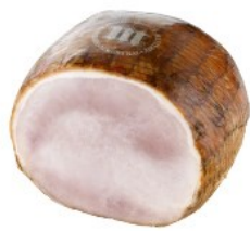
Rubens ham Grillham