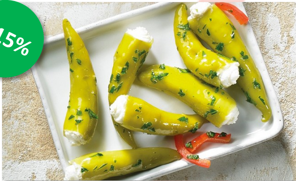
Groene Peperoni gevuld 750gr