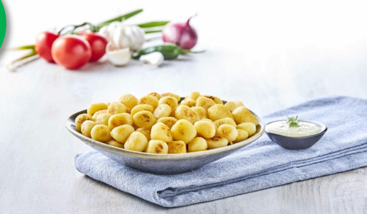
Mini Kriel 2kg