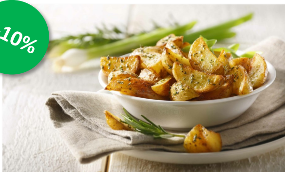
Aardappelpartjes met rozemarijn