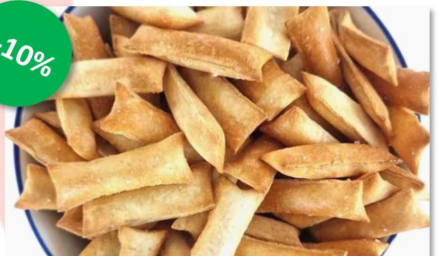
Geblazen brood Soplado 800gr