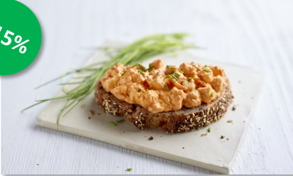
Kip Andalouse 1kg