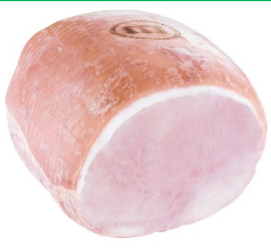
Rubens ham Ham