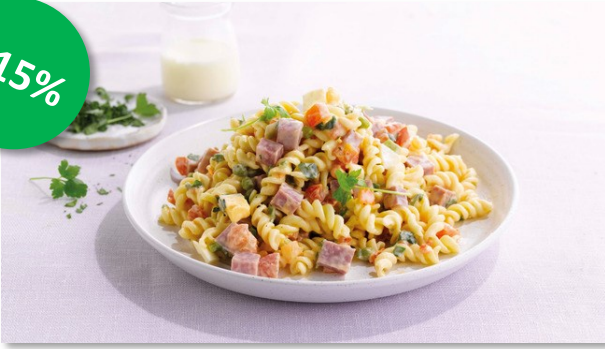
Pasta met Ham 2kg