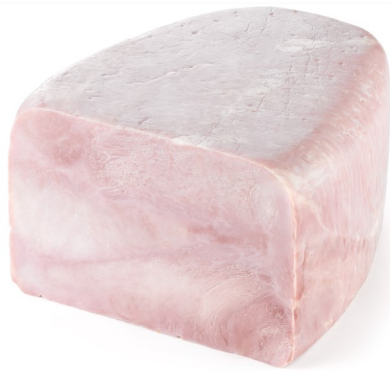
Achterham Grand Cru ontvet

Bij aankoop 2 stuks = -25% Enkel week 17- 18