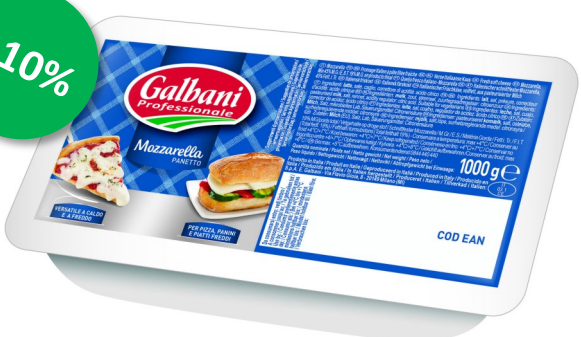
Mozzarella blok 1kg