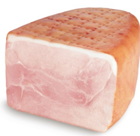
Grand Cru Achterham met