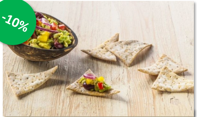
Apero Dipper met kruiden 800gr