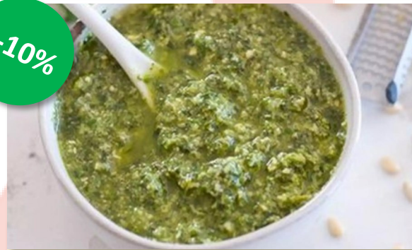
Groene pesto alla genovese 900ml