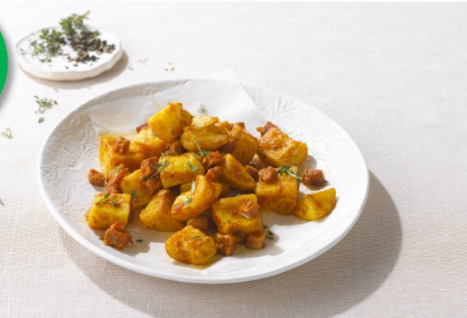
Patatas Bravas 2kg