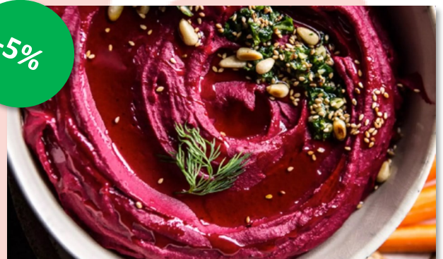
Hoemoes Rode biet 1,5kg