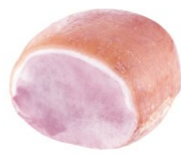
Grand Cru ham natuur