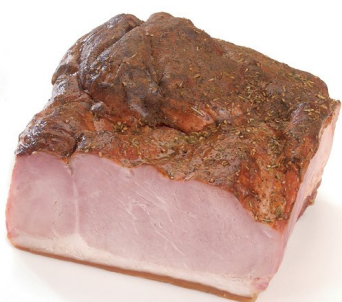
Breydelham elite 3.5kg