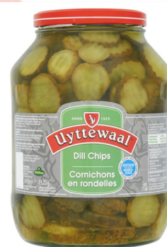
Augurken gesneden 2,4kg Uyttewaal