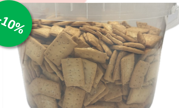
Regana Sesam 1,5kg