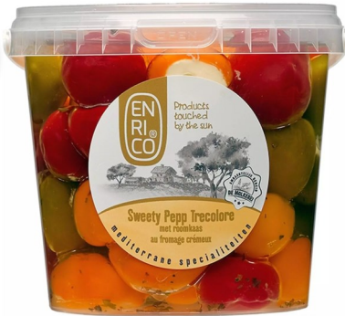
Pepers Trecolore 1kg